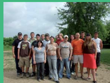
Précédente rencontre jeunes Allemands, Tchèques et Français à Bourbon-Lancy en 2008.